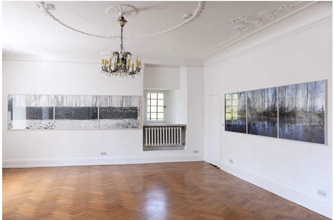
Installationsansicht, Burg Lede Bonn, 2026