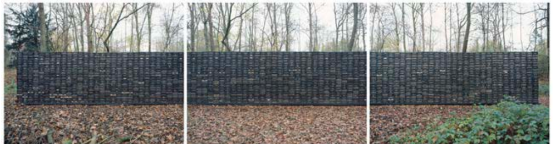
Philipp Goldbach: Image Cycle (Herbst), 2021

Triptychon, C-Prints je 47 x 59 cm (Bildformat) 48,5 x 180 cm (Gesamtformat inkl. Rahmen) Edition 2/5+1 AP