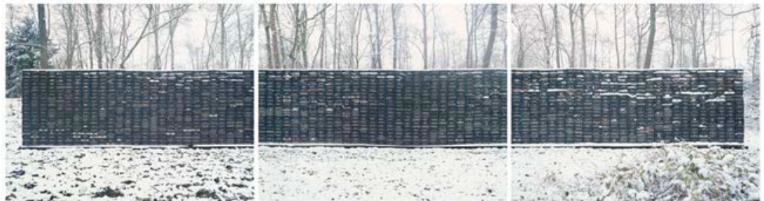
Philipp Goldbach: Image Cycle (Winter), 2021

Triptychon, C-Prints je 88,5 x 110,5 cm (Bildformat) 91,5 x 340,5 cm (Gesamtformat inkl. Rahmen) Edition 1/3+1 AP,