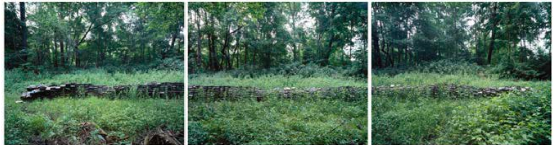
Philipp Goldbach: Image Cycle (Sommer), 2021