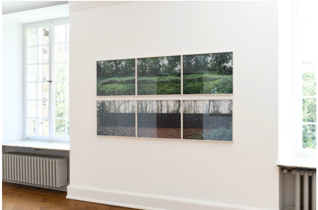
Installationsansicht, Burg Lede Bonn, 2026