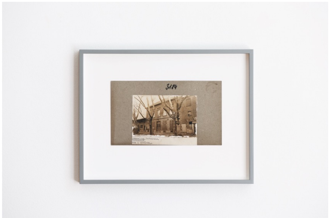
Philipp Goldbach: Image Cycle, drei gerahmte Originalabzüge aus dem Rheinischen Bildarchiv, die beim Abbau der Installation im Park von Burg Lede gefunden wurden, 2021