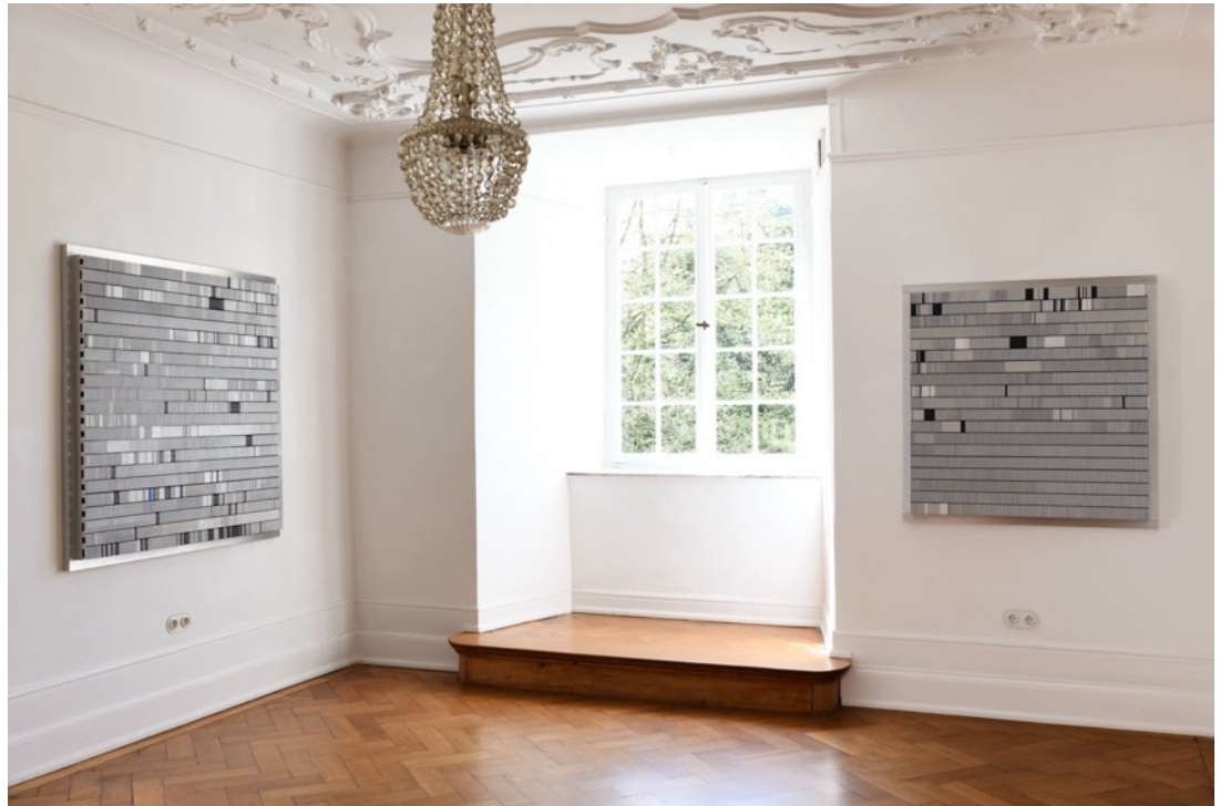
Installationsansicht, Burg Lede Bonn, 2026