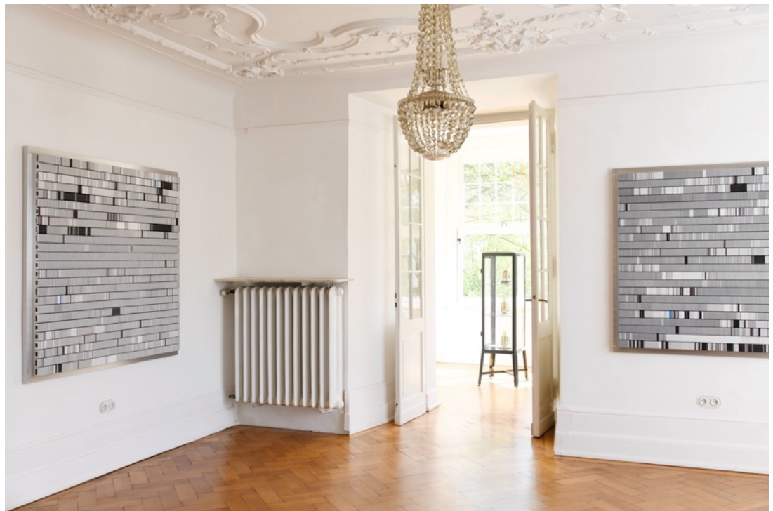
Installationsansicht, Burg Lede Bonn, 2026