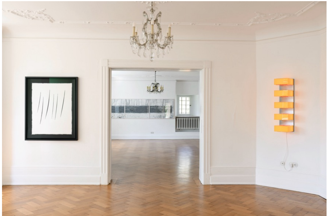
Installationsansicht, Burg Lede Bonn, 2026