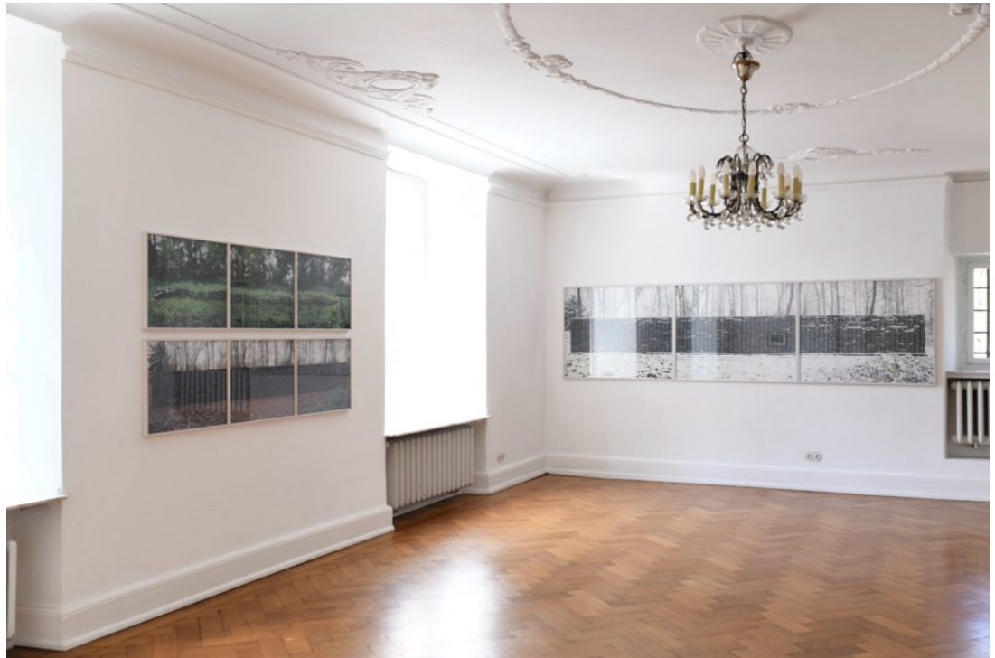
Installationsansicht, Burg Lede Bonn, 2026