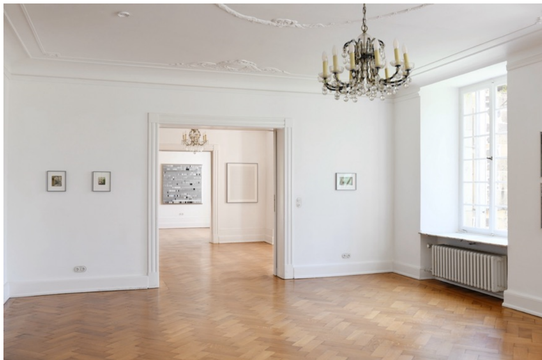
Installationsansicht, Burg Lede Bonn, 2026