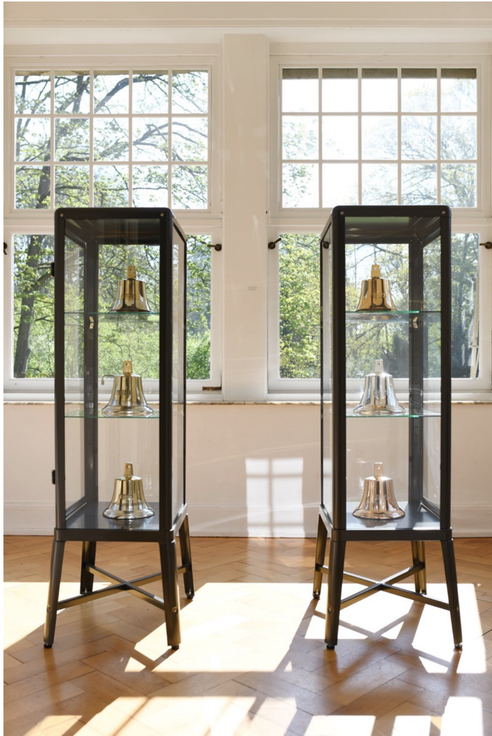
Installationsansicht, Burg Lede Bonn, 2026