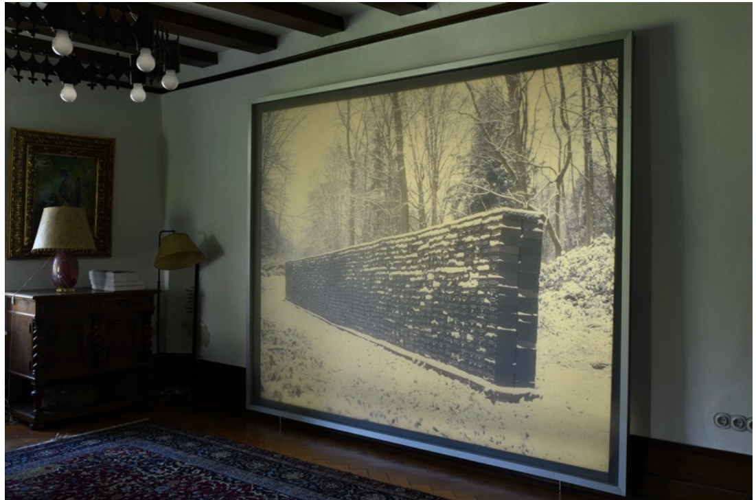
Installationsansicht, Burg Lede Bonn, 2026