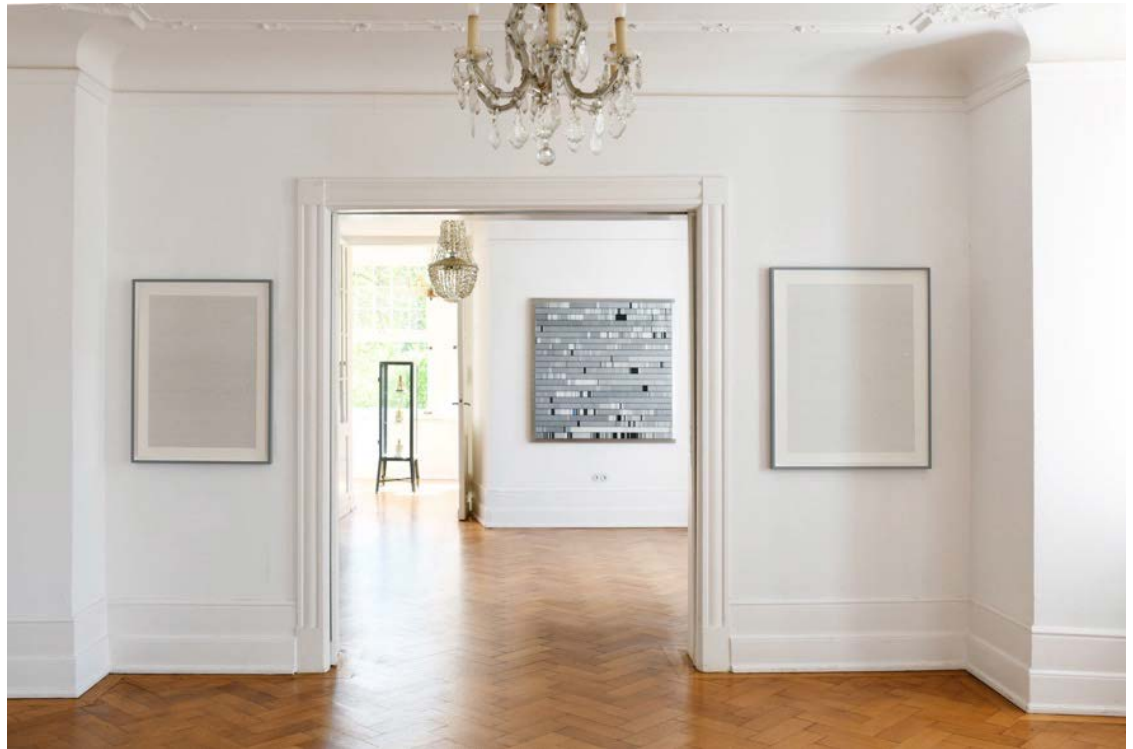
Installationsansicht, Burg Lede Bonn, 2026