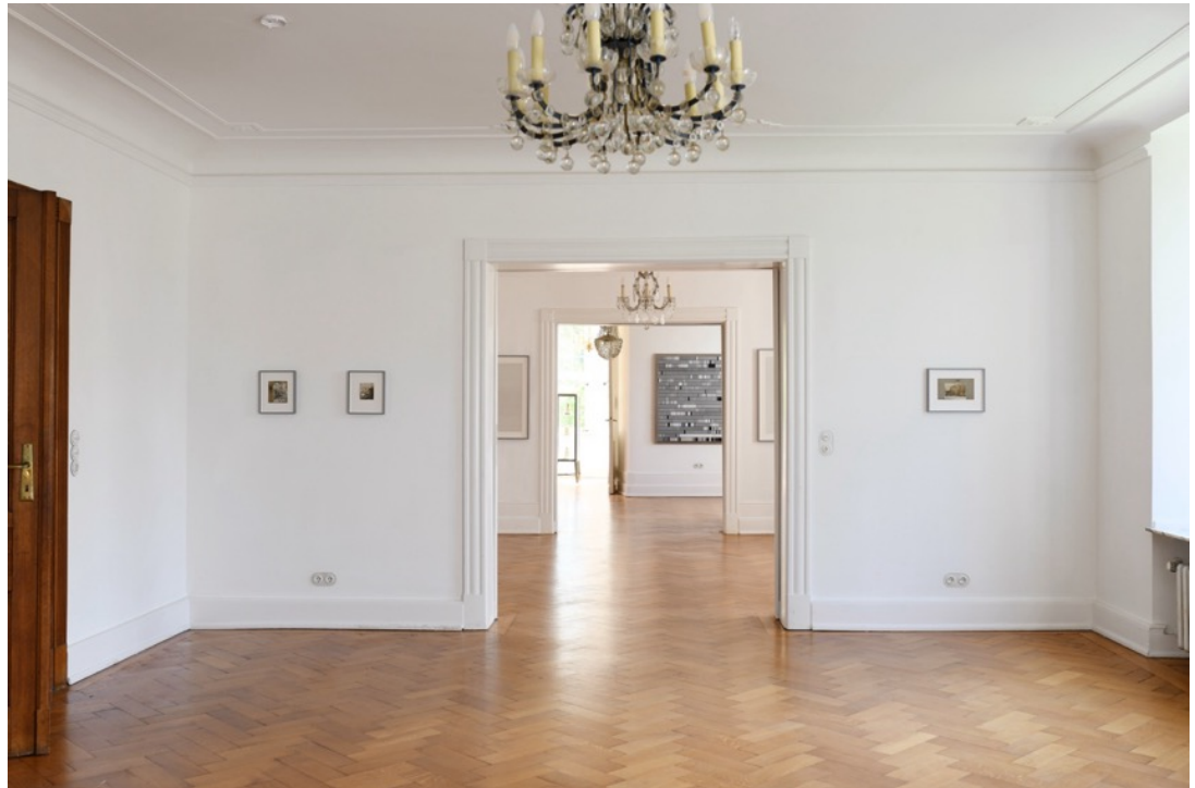
Installationsansicht, Burg Lede Bonn, 2026